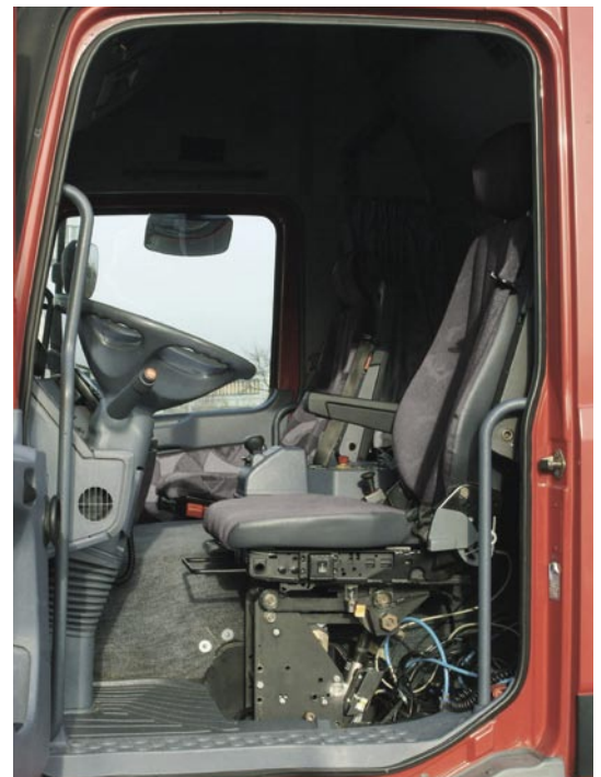
▲ Der Prototyp der aktiven Sitzfederung integriert in eine Fahrerkabine.